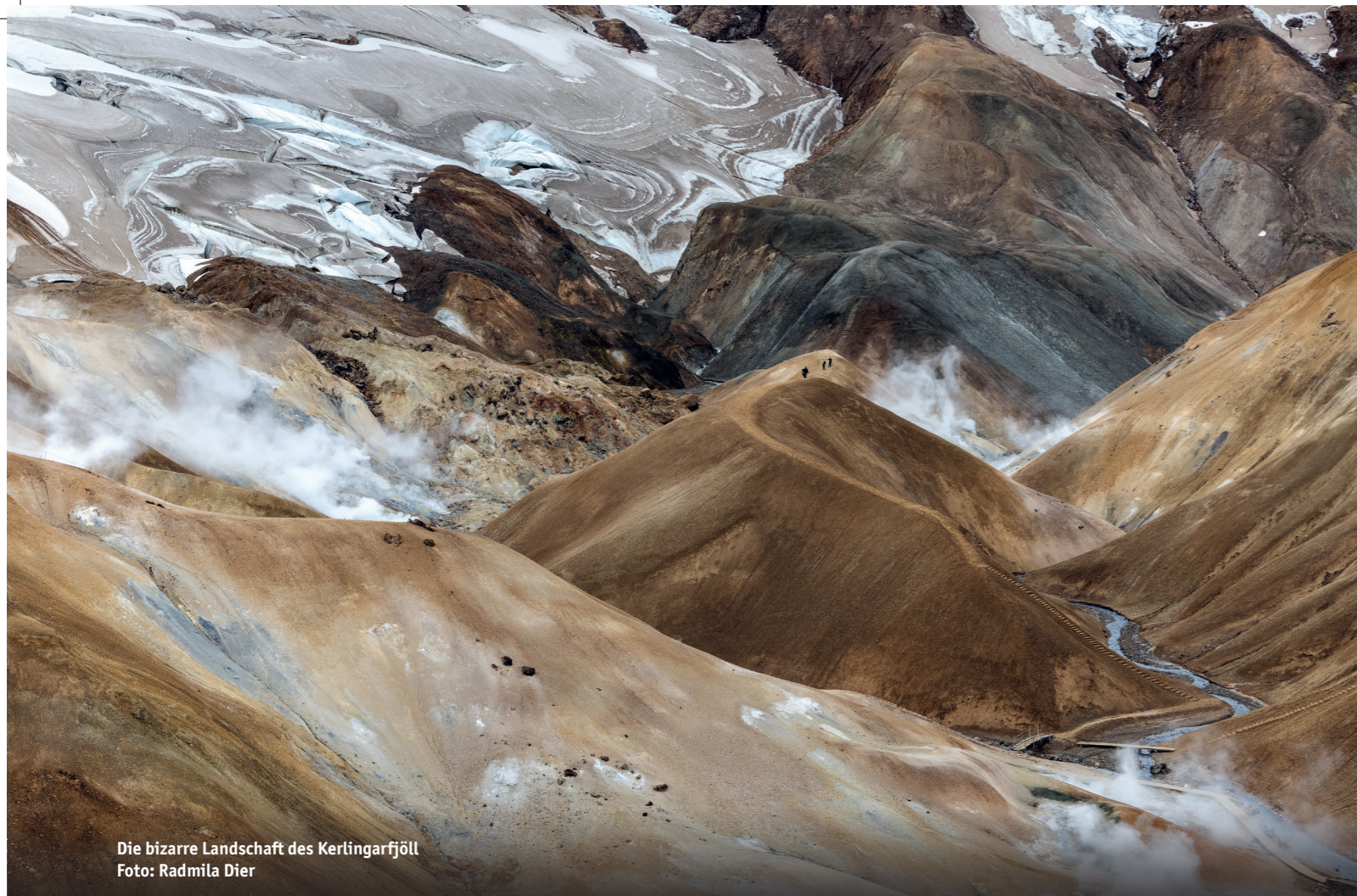
Die bizarre Landschaft des Kerlingarfjöll