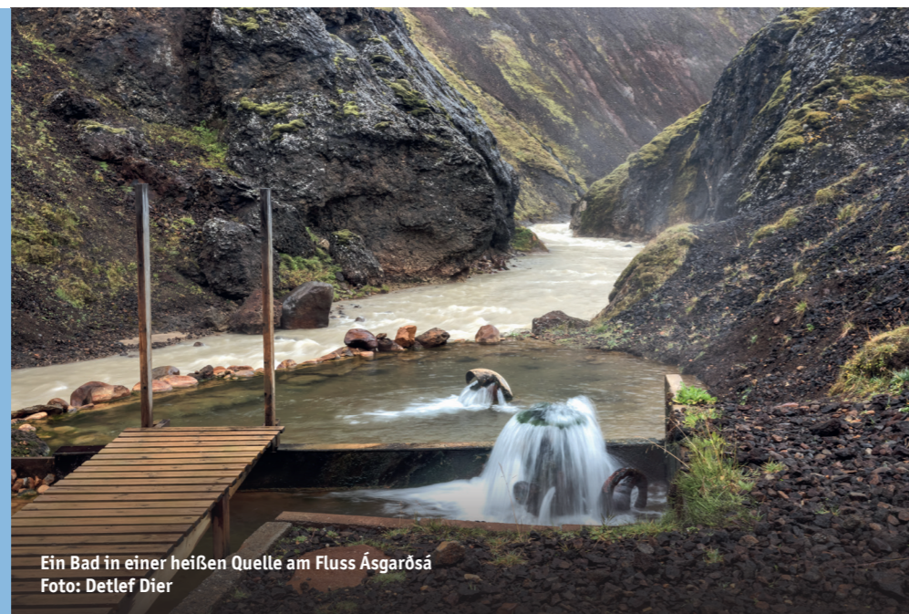
Ein Bad in einer heißen Quelle am Fluss Ásgarðsá

diese Region von der dynamischen geologischen Geschichte Islands und beeindruckt durch ihre natürliche Schönheit und Vielfalt. Es ist nicht weiter verwunderlich, dass Kerlingarfjöll