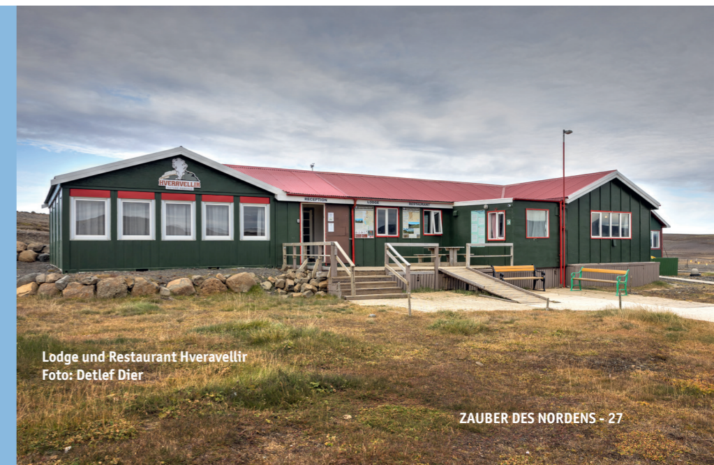
Lodge und Restaurant Hveravellir

www.hveravellir.is Tel.: +354 452 4200 E-Mail: info@hveravellir.is