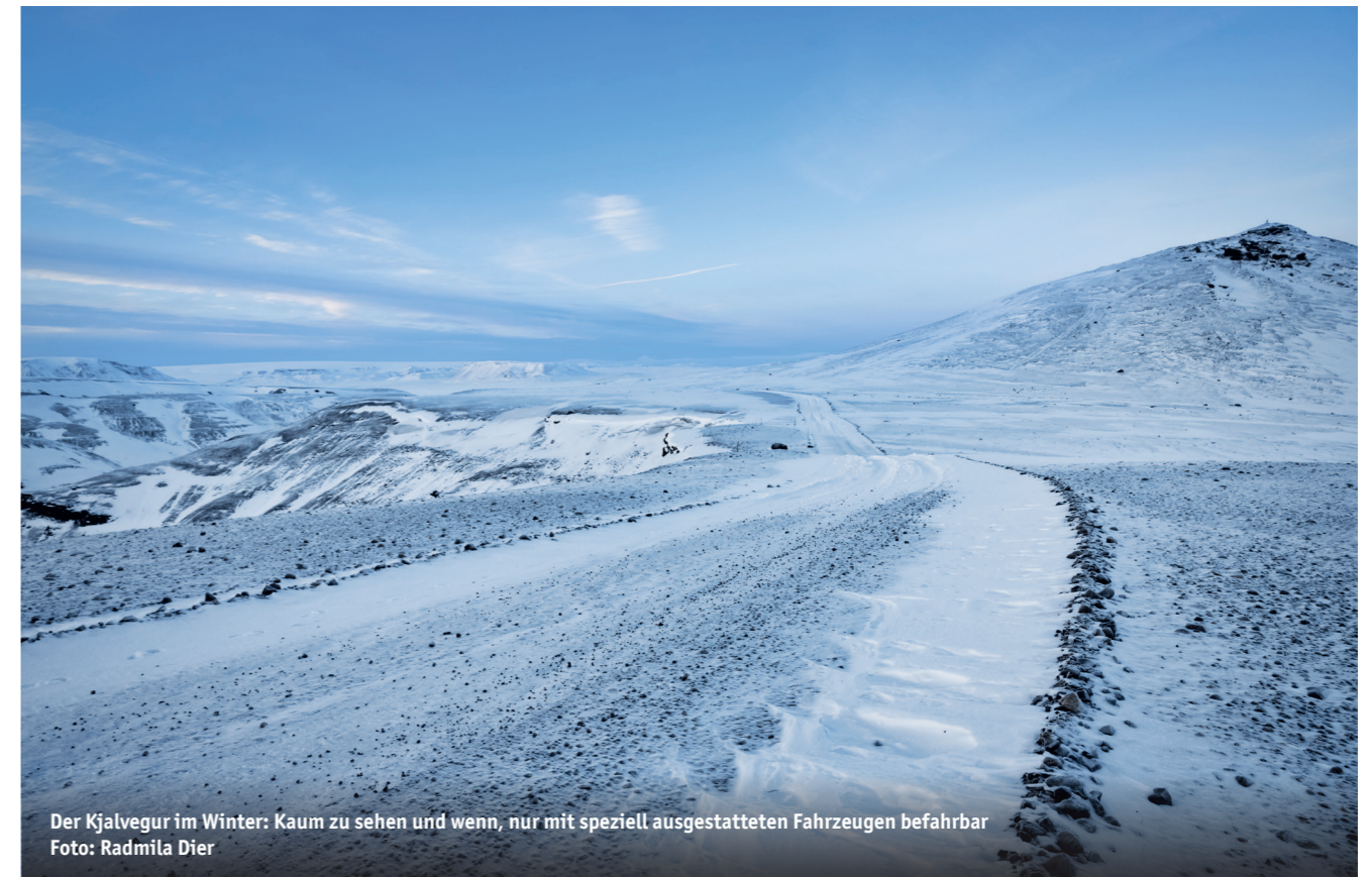
Der Kjalvegur im Winter: Kaum zu sehen und wenn, nur mit speziell ausgestatteten Fahrzeugen befahrbar

Der weitere Weg führt durch das Blöndudalur Tal. Wenn man rechts auf die Svínvetningabrut (Straße 731) abbiegt, gelangt man zur Ringstraße und nach ca. 32 Kilometer schließlich in die Stadt Blönduós im Norden.