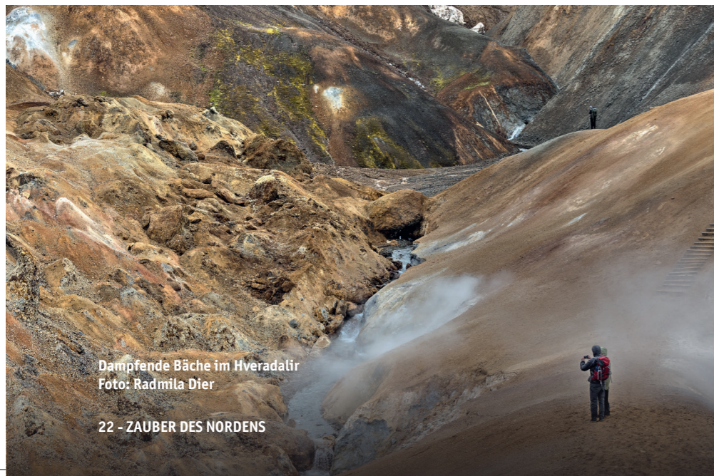
Dampfende Bäche im Hveradalir