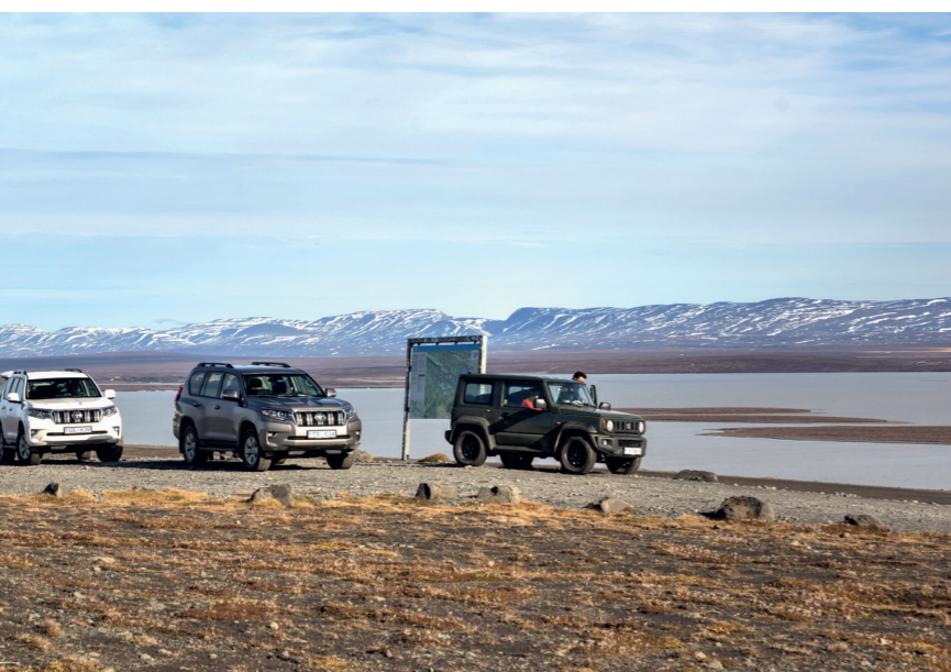
An einem Parplatz auf der Höhe des Blöndulón

Noch ein Tipp zum Schluß: Auf jeden Fall vorher tanken, denn auf der Strecke gibt es keine Möglichkeit, auch wenn in älteren Reiseführern oder anderen Publikationen eine Tankmöglichkeit bei Hveravellir angegeben wird. Das ist nicht korrekt.