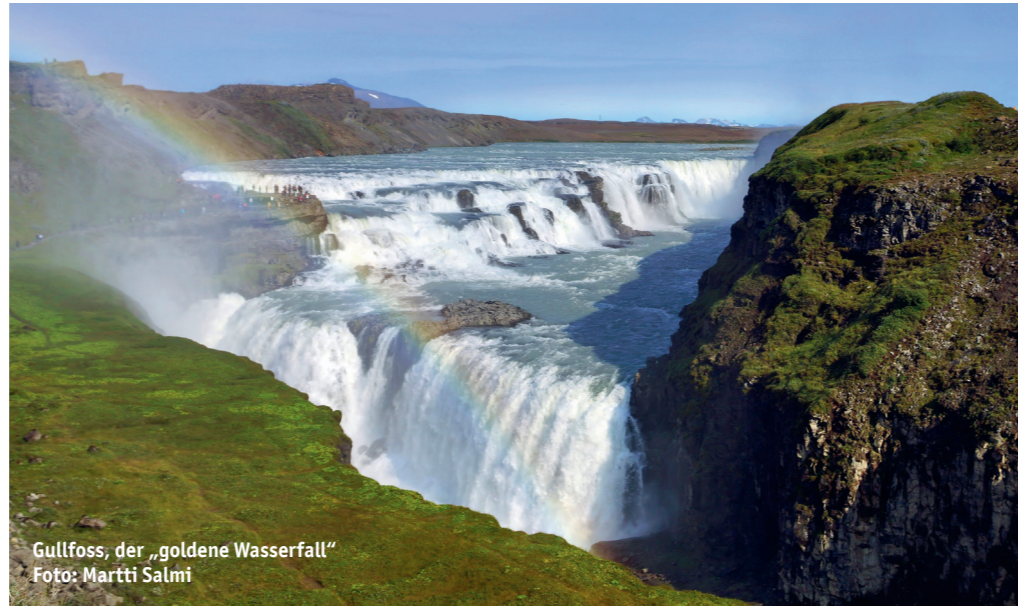
Gullfoss, der „goldene Wasserfall“

Das Abenteuer auf der Kjalvegur, der früheren F35, beginnt am berühmten Wasserfall Gullfoss im Süden des Landes. Der Buchstabe „F“ bedeutet „fjall“