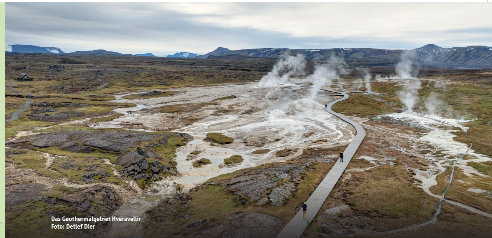
Das Geothermalgebiet Hveravellir