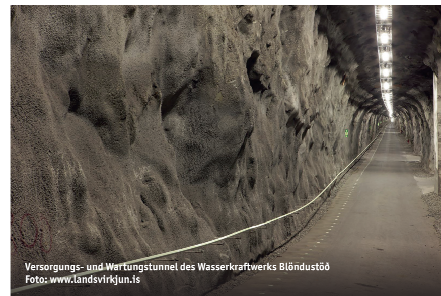
Versorgungs- und Wartungstunnel des Wasserkraftwerks Blöndustöð

Die Geschichte um Fjalla-Eyvindur wurde in einem Theaterstück von Jóhann Sigurjónsson und später in einem Film von Victor Sjöström im frühen 20. Jahrhundert verarbeitet. Fjalla-Eyvindur verstarb 1783.