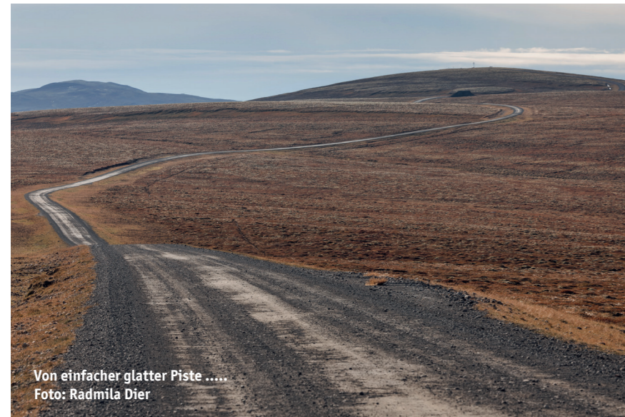
Von einfacher glatter Piste .....

Schon vor Jahrhunderten war die Region rund um die Kjölur-Route eine wichtige Verbindung zwischen dem Süden und dem Norden Islands. Der historische „Kjalvegur hinn forni“ (alter Kjalvegur) führte westlich der 35 und wurde als Handelsweg oder für Reisen zum Versammlungsort Pingvellir