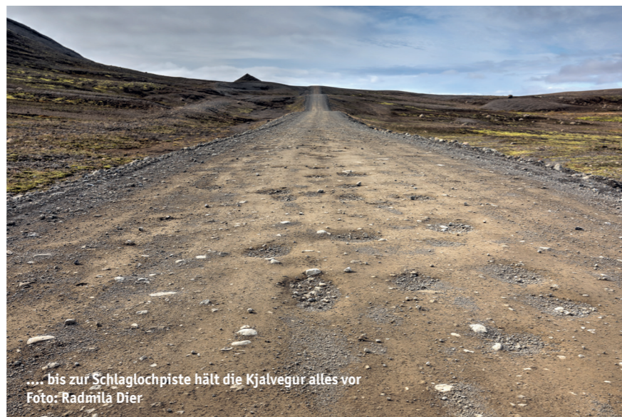
.... bis zur Schlaglochpiste hält die Kjalvegur alles vor

Anders als die Hauptstraße mit der Nummer 1, die als Ringstraße das gan-