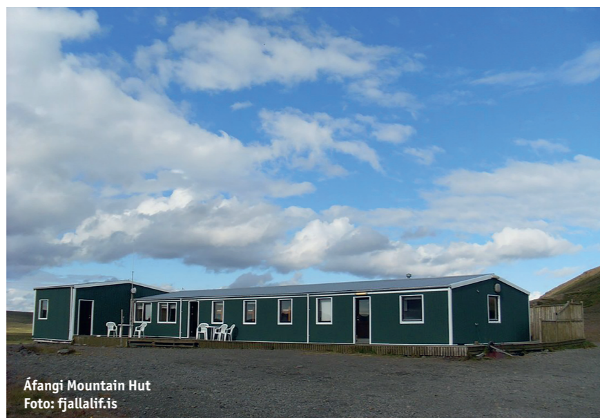
Áfangi Mountain Hut

Die Kjölur-Route bietet ein unvergleichliches Abenteuer abseits der Hauptstraßen und eröffnet einen tiefen Einblick in Islands abgelegene Naturwunder. Für alle, die die Herausforderung einer Fahrt durch das isländische Hochland annehmen, ist die 35 mehr als nur eine Straße – sie ist eine Reise in eine andere Welt, wo sich unberührte Natur und jahrhundertalte Geschichte miteinander verweben. Wer auf der Suche nach einem Abenteuer ist, das die Sinne belebt und die Seele inspiriert, wird hier auf seine Kosten kommen.