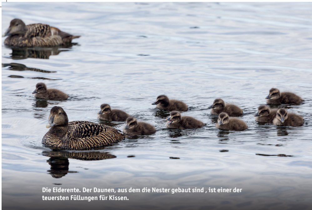
Die Eiderente. Der Daunen, aus dem die Nester gebaut sind, ist einer der teuersten Füllungen für Kissen.