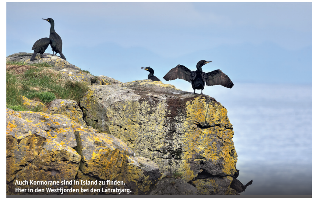
Auch Kormorane sind in Island zu finden. Hier in den Westfjorden bei den Láttrabjarg.

Paradies für Odinshühnchen und auch der Goldregenpfeifer (lat.: Pluvialis apricaria ), Islands inoffizieller Nationalvogel, ist hier zu sehen. Offizieller Nationalvogel ist allerdings der Gerfalke und auch der Papageitaucher ist