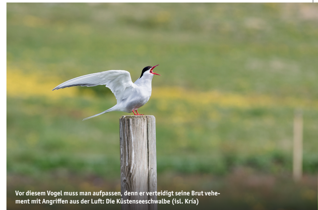
Vor diesem Vogel muss man aufpassen, denn er verteidigt seine Brut vehement mit Angriffen aus der Luft: Die Küstenseeschwalbe (isl. Kría)

Ein besonderes Highlight in den Westfjorden ist außerdem die kleine Insel Vigur im Ísafjarðardjúp. Das kleine Eiland ist seit dem 12. Jahrhundert besiedelt. Heute gibt es dort nur noch einen einzigen Hof, der seit dem 19. Jahrhundert von derselben Familie bewirtschaftet wird. Hier brüten unzählige Papageitaucher, Küstenseeschwalben und Eiderenten. Letztere bieten eine lukrative Einnahmequelle: Die Familie lebt unter anderem vom Sammeln der Eiderdaunen, die per Hand eingesammelt und direkt auf der Insel gereinigt werden. Die Eiderdaune ist das teuerste Füllgut für Daunendecken (1 kg kostet bis zu 5.000 EUR), ein Großteil dieser Kostbarkeit wird mitunter nach Deutschland exportiert.