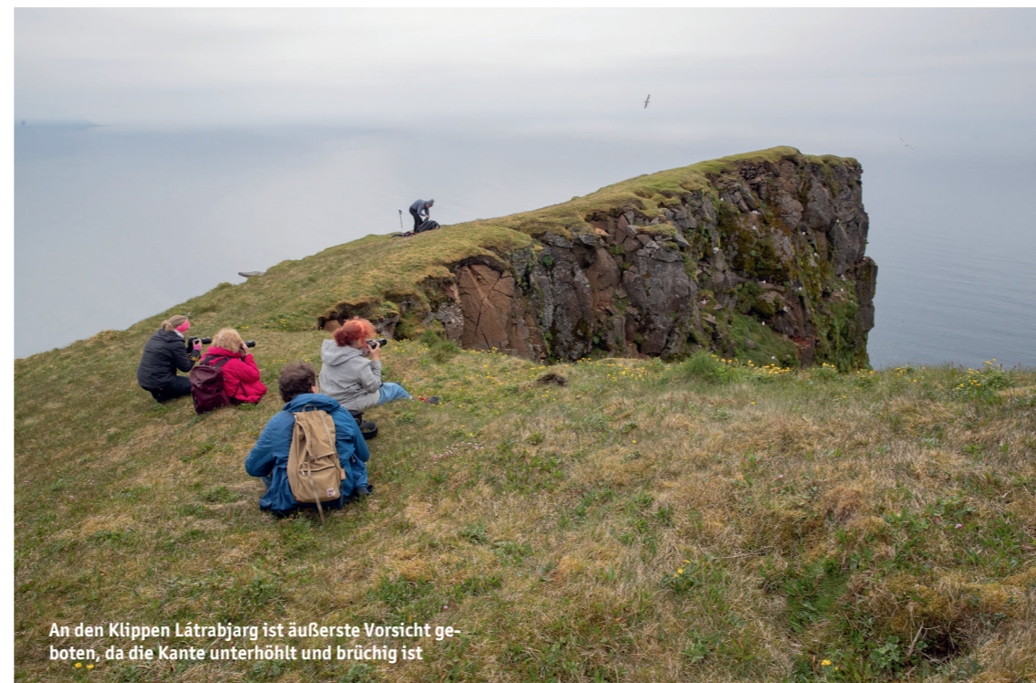
An den Klippen Láttrabjarg ist äußerste Vorsicht geboten, da die Kante unterhöhlt und brüchig ist

Achtung: die Vögel brüten in Erdlöchern an der Klippe. Dadurch wird der Rand für Besucher instabil! Bitte nicht zu nahe an den Rand gehen, oder am besten gleich auf den Bauch legen. Wer Glück hat, entdeckt auch den Falken (lat.: Falco rusticolus ), Islands größten Greifvogel, hoch oben auf den Klippen.