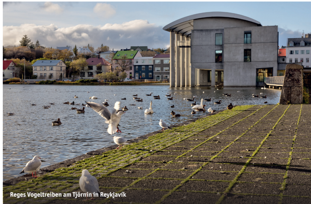
Reges Vogeltreiben am Tjörnin in Reykjavík

Der Stadtsee Tjörnin, mitten in der Hauptstadt Reykjavík, ist der städtische Hotspot für Wasservögel. Hier lassen sich Eiderenten (lat.: Somateria mollissima), Reiherenten (lat.: Aythya fuligula), Graugänse (lat.: Anser anser), verschiedene Möwenarten (lat.: Larus spp.) und im Sommer sogar Isländische Seeschwalben (lat.: Sterna paradisaea) beobachten. Besonders morgens ist der See eine Oase der Ruhe