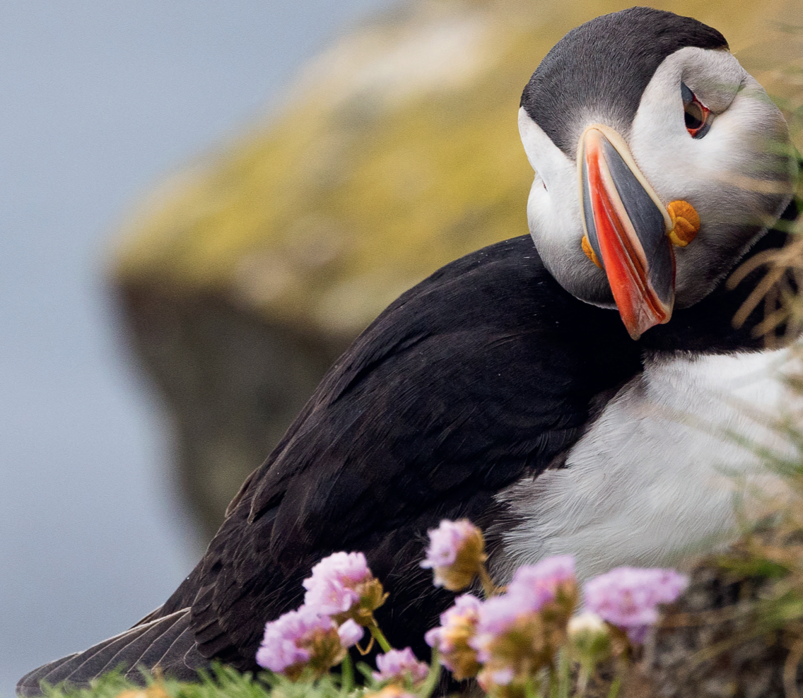
Papageitaucher an der Klippe Látrabjarg in den Westfjorden

Es gibt aber noch so viel mehr Vogelarten zu sehen. In diesem Artikel stelle