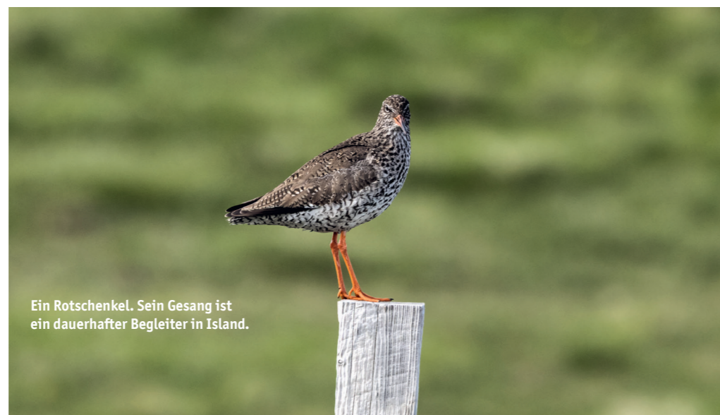
Ein Rotschenkel. Sein Gesang ist ein dauerhafter Begleiter in Island.

Vom Wasser aus sind die Vogelfelsen besonders spektakulär! Zwei Arten von Bootstouren stehen zur Auswahl: Eine ca. 1,5-stündige Fahrt mit einem größeren Boot ( islandboattours.is ) oder ein spannender Trip mit einem RIB-Speedboot ( ribsafari.is ). Beide Touren umrunden Heimaey, besuchen beeindruckende Klippen, Höhlen und – je nach Route – weitere Inseln der Westmännergruppe.