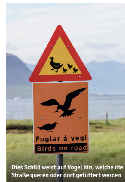
Dies Schild weist auf Vögel hin, welche die Straße queren oder dort gefüttert werden

In Stykkishólmur oder Grundarfjörður werden Ausflüge angeboten, bei denen man Papageitaucher, Eissturmvogel (lat.: Fulmarus glacialis), Krähscharben, Lummen und viele Möwenarten sehen kann.