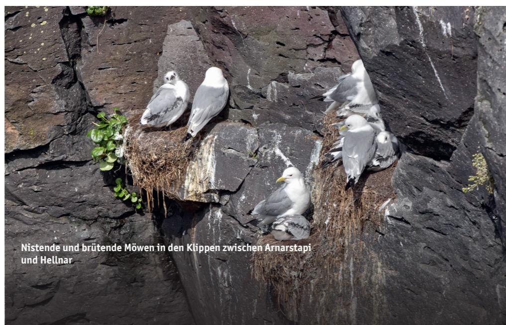
Nistende und brütende Möwen in den Klippen zwischen Arnarstapi und Hellnar

Die Halbinsel Snæfellsnes ist ein wahres Vogelparadies. Besonders beeindruckend sind die Vogelfelsen von Arnarstapi und Hellnar, wo Trottellummen (lat.: Uria aalge), Tordalken (lat.: Alca torda) und Dreizehnmöwen (lat.: Rissa tridactyla) dicht an dicht nisten. Hier trifft man auch auf die Krähscharbe (lat.: Phalacrocorax aristotelis), einen eleganten, schwarzen Meeresvogel mit grünlichem Schimmer im Gefieder. Die Krähscharbe brütet in Kolonien an Felswänden und ist an ihrem schlanken, gebogenen Schnabel